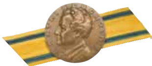
Katri Bergholm -mitali

Sotilaskotiansioristiä kannetaan nauhassa muiden kunniamerkkien tapaan, sotilaskotiasussa myös nauhalaattana. Sotilaskotiansioristiä voidaan kantaa myös siviiliasussa.